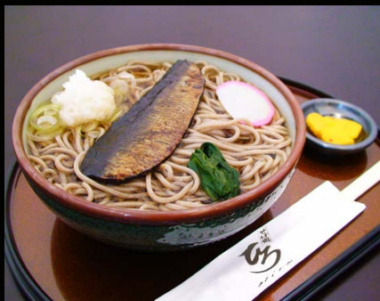
■にしんそば 冷 温 …1,050 円