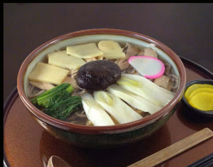
■鳥そば 冷 温 …1,000 円