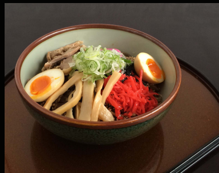
■あぶらそば 温 …900 円