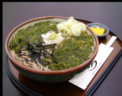
■めかぶそば 冷 温 …900 円