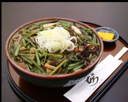
■山菜そば 冷 温 …1,000 円