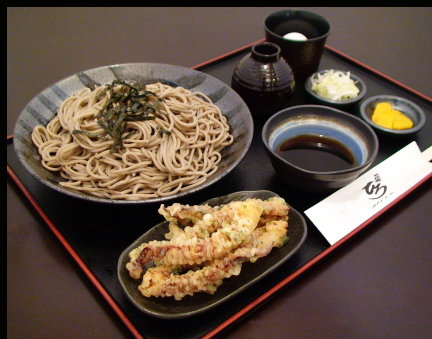
■げそ天ざるそば…950 円

※おろしを別皿には出来ません。別皿にする場合は肉そばとおろしトッピングの単品扱いになります。